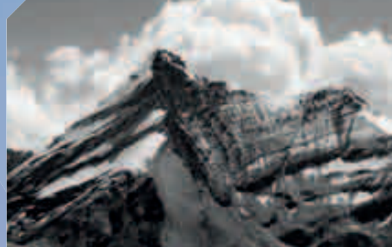
MOSTRA FOTOGRAFICA "AROUND GRIVOLA"

A cura della Fondazione Sapegno Tour de l'Archet, negli orari di apertura della Pro Loco.